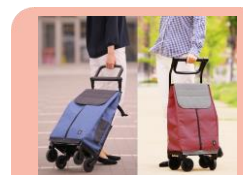
可動ハンドルは、「押す」「引く」の切替がカンタン（特許出願中）