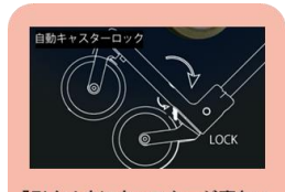
「引く」ときにキャスターが寝ない新機構を搭載（特許出願中）