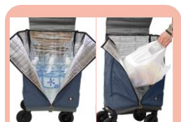
30Lの大容量バッグは、下まで開けるファスナー付き