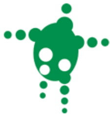
「ロボット大賞」シンボルマーク

「今年のロボット」大賞シンボルマーク「ロボット大賞」におけるロボットの定義である、「センター、知能・制御系、駆動系」の3つの技術要素を有する、知能化した機械システム」を表現したシンボルマークです。